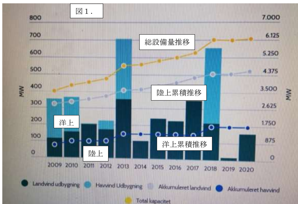
図 1、デンマークにおける風車の導入実績（単位 MW=千 kW）。

今から 10 年前の「風のがっこう便り 2010 年」において、デンマーク政府議会はデンマークの 2020 年における風力発電の発電量目標は対電力消費量に対し約 50%ということについて記述しました。それを達成するためには陸上（陸内）に 350 万 kW そして洋上に 280 万 kW 計 630 万 kW の風力発電の設備を設置することを目標を掲げていました。それではその目標に対し実績はどうなったか。